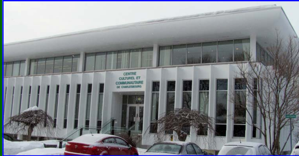
Centre culturel et communautaire de Charlesbourg